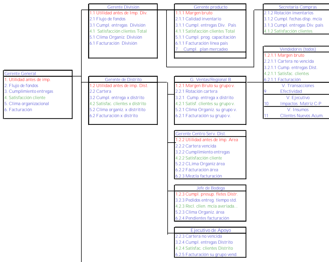
Figura # 2 Arbol de despliegue de objetivos

NOTA. Cuando la medición del cumplimiento de un objetivo no se puede hacer mensualmente sino por períodos de tiempo más largos, el resultado mensual se mantendrá hasta tanto haya una nueva medición.